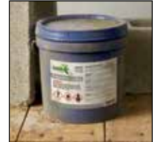
Saleté, contaminant abrasif

Grâce à un adhésif puissant de qualité marine, les étiquettes SGH pour produits chimiques UltraDuty MC Avery® répondent aux normes BS5609 des tests en milieu marin pour la résistance et la durabilité dans l'eau de mer pendant 90 jours. À l'épreuve de l'eau, résistantes aux produits chimiques, à l'abrasion, à la lumière du soleil, à la déchirure et aux températures extrêmes, elles sont idéales pour étiqueter les produits assujettis au SGH et conviennent à d'autres applications, notamment : enseignes de sécurité de l'HST, étiquettes pour danger d'arc électrique, réservoirs ainsi que travaux maritimes et à l'extérieur.