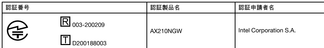
Table 1. 無線LAN / Bluetooth アダプター

本製品が装備する無線アダプターは、電波法および電気通信事業法により技術基準認証を下記のとおり取得しています。本製品に組み込まれた無線設備を他の機器で使用する場合は、当該機器が上記と同じく認証を受けていることをご確認ください。認証されていない機器での使用は、電波法の規定により認められていません。